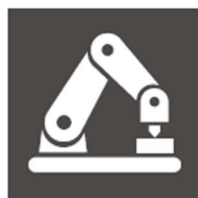
機械・制御エンジニア科