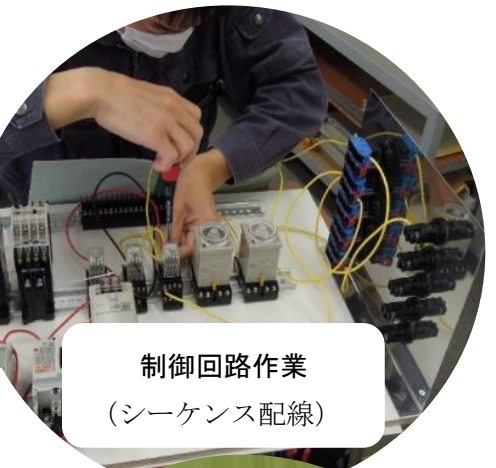
制御回路作業 (シーケンス配線)